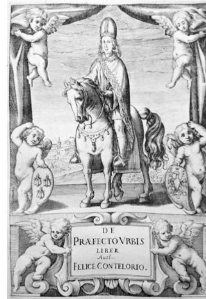
Abb. 1 | Felice Contelori, De praefecto Urbis , Rom 1631 (Ausgabe der Bibliotheca Hertziana – Max-Planck-Institut für Kunstgeschichte), Frontispiz.

Die sorgfältige Beschreibung der vestimentären Details steht im Zusammenhang mit dem legitimatorischen Charakter der Robe. Mochi Onori betont in diesem Zusammenhang die essentielle Bedeutung einer gewissenhaften Wiedergabe der traditionellen Kleidungsstücke, da diese die Grundlage zur Identifikation des Amtes bilden. 14 Erst die Robe macht den Stellenwert des Amtes sichtbar und festigt gleichzeitig den Status der päpstlichen Familie. Dieser Sachverhalt war auch den Barberini bewusst, die großen Wert auf eine authentische Reproduktion der Kleidung legten.