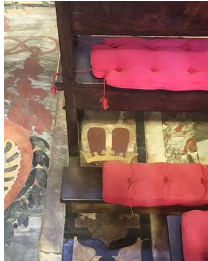
Abb. 6 | Detail von Abb. 5: Präfektenkappe.

Palestrina und dort einen Familienpalast mit angrenzender Kirche, die zu Beginn des 18. Jahrhunderts sukzessive zur neuen Familiengrablege ausgebaut wurde. 34 1735 ließ Kardinal Francesco Barberini d. J. (1662–1738) dort an den Seitenwänden des Chores zwei Monumente errichten (Abb. 7–8), die aus zwei fingierten Logen bestehen, in denen je eine Büste untergebracht ist. Rechts ist ein Kardinal zu sehen, links eine Person weltlichen Standes, welche die Züge Urbano Barberinis (1664–1722) trägt und dem eine Präfektenkappe und der Orden vom Goldenen Vlies beigegeben sind (Abb. 9). Urbano, ab 1685 weltliches Oberhaupt der Familie und Fürst von Palestrina, war das letzte Mitglied der Familie, das den Präfektentitel innehatte, der 1705 nach dem Tod seines Onkels Carlo Barberini an ihn überging. 35