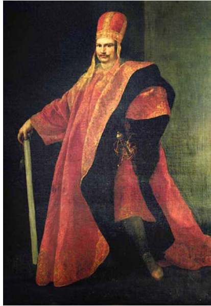
Abb. 4 | Andrea Sacchi, Bildnis Taddeo Barberinis als Präfekt von Rom, 1631–1633 , 250 x 150 cm, Öl/Leinwand, Rom, Istituto Nazionale della Previdenza Sociale.

mit Anna Colonna (1601–1658) mit einer der ältesten römischen Adelsfamilien verschwägert und ab 1630 durch den Erwerb des Fürstentums Palestrina mit einem Adelstitel ausgezeichnet war, stellte die Präfektur eine zusätzliche Gelegenheit dar, den neu errungenen Status in der römischen Elite weiter zu konsolidieren. Die feierliche Amtseinführung wurde mit verschiedenen Festakten begangen, die sowohl in zeitgenössischen Berichten als auch in verschiedenen Bildwerken thematisiert wurden. 18 Eröffnet wurden sie am 3. August 1631 mit dem Einzug des Fürsten in die Stadt, dem drei Tage später die offizielle Investitur in der Cappella